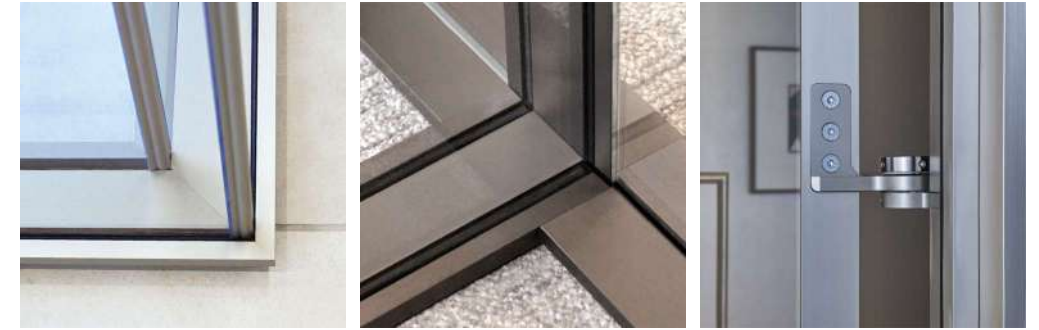
R 11 PURE WHITE R 04 ANTHRACITE R 06 BLACK